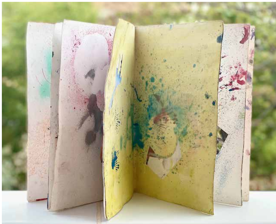
Petxina. 88x62 cm. Collage y acuarela sobre papel.