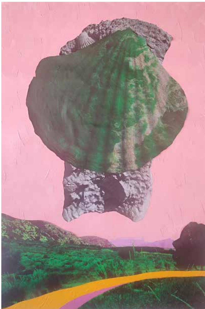
Totem. 43x64 cm. Mixta, acrílico y fotografía.