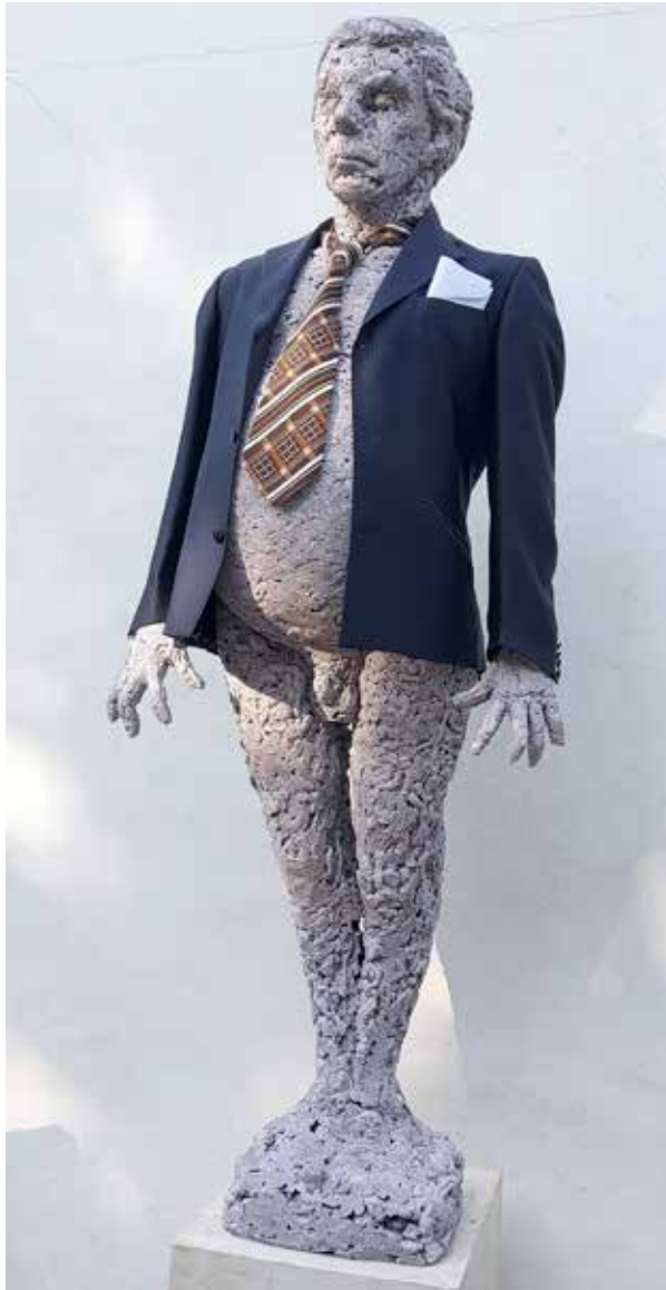
Ceci n'est pas un fossile, n'est-ce pas ? . 170x68x37 cm. Espuma de poliuretano y textil.