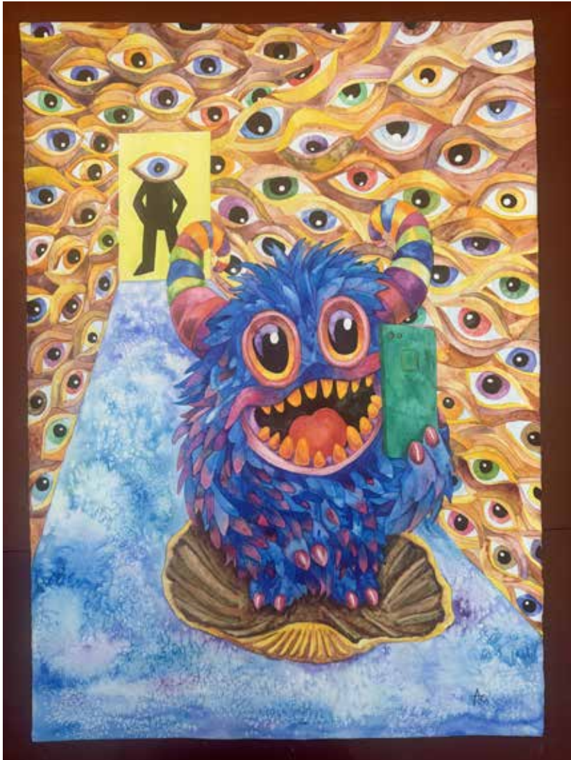
MonsterSelfie. 70x50 cm. Acuarela sobre papel.

https://www.instagram.com/andrescarlos71/