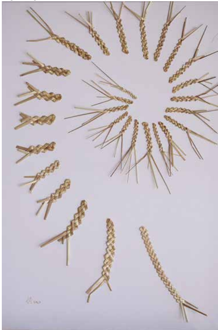
El cornesuelo del centeno. 90x60 cm. Paja de centeno trenzada sobre lienzo.

olallamt@hotmail.com - http://lalybelulilla.blogspot.com/ https://www.instagram.com/lalybertadespartedeti/ https://espanaartesana.com/laly-belula