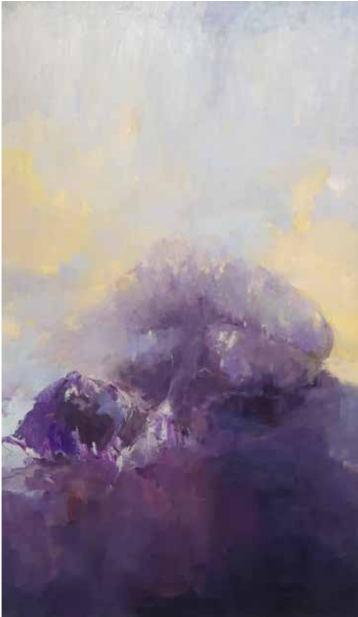
Metamorfosis. 195x114 cm. Óleo sobre lienzo.