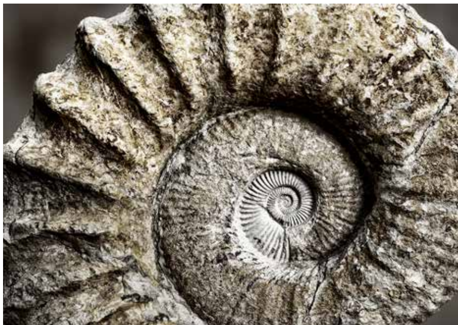
Proporción áurea. 59x42 cm. Fotografía. Impresión digital en papel de algodón.

foto@josemanuelsaiz.com - http://josemanuelsaiz.com