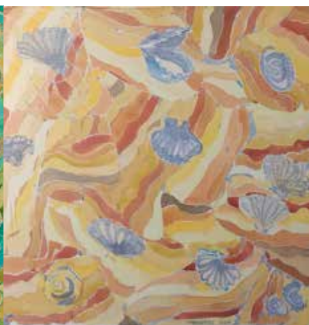
Y el agua se retiró.

Cuatro piezas de 90x90 cm. Técnica mixta sobre seda.