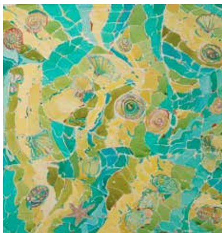
y las mareas.