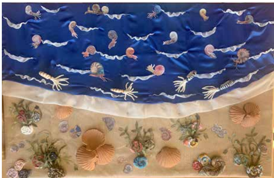
Ayer y hoy. 70x120 cm. Collage.