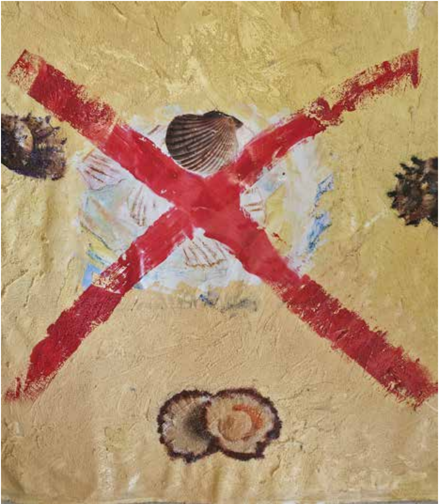
No soy crustáceo. 130x120 cm. Mixta sobre tela.

bouselles@gmail.com - www.nicobouselles.com - Instagram: nicobouselles