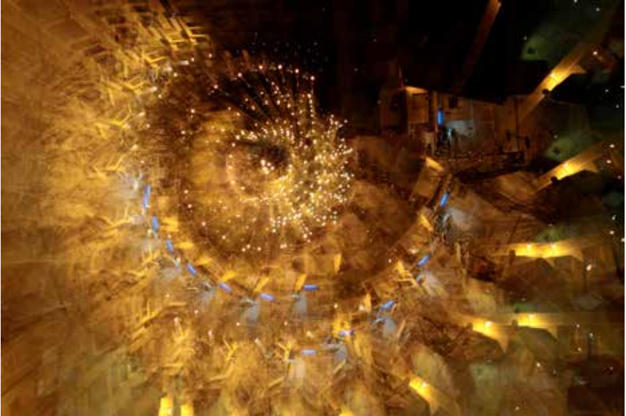
Nautilus. 40x27 cm. Totografía digital.

antonizek@gmail.com - http://lamagiadelanoche.com