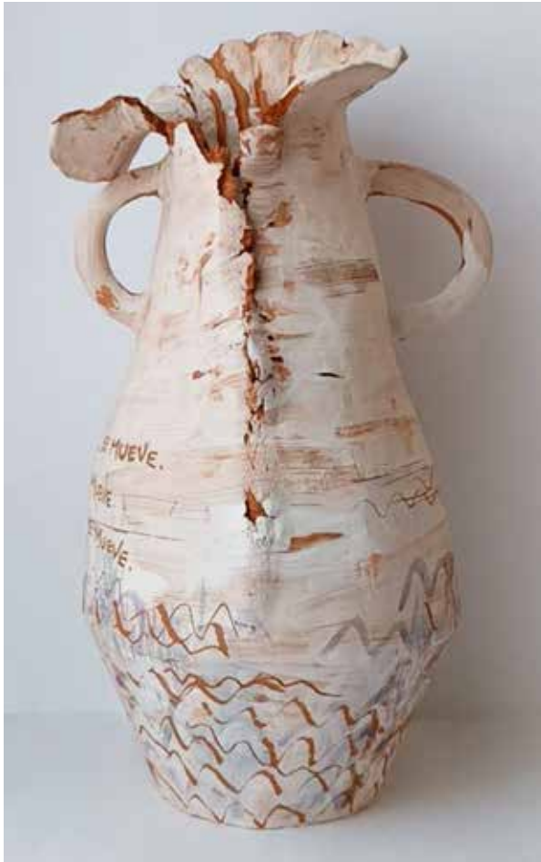
Mujer de concha blanca. 46x22x25 cm. Cerámica.

mjocjumilla@gmail.com - Instagram: chus.ortiz