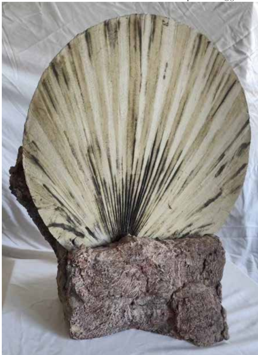
Lo encontrado. 49x56x35 cm. Técnica mixta: poliespán, yeso, pintura acrílica y cerámica.