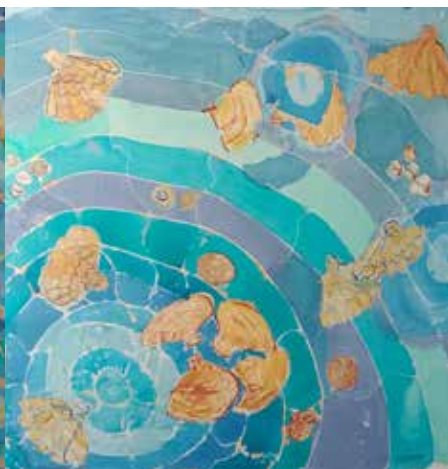
Vino el mar