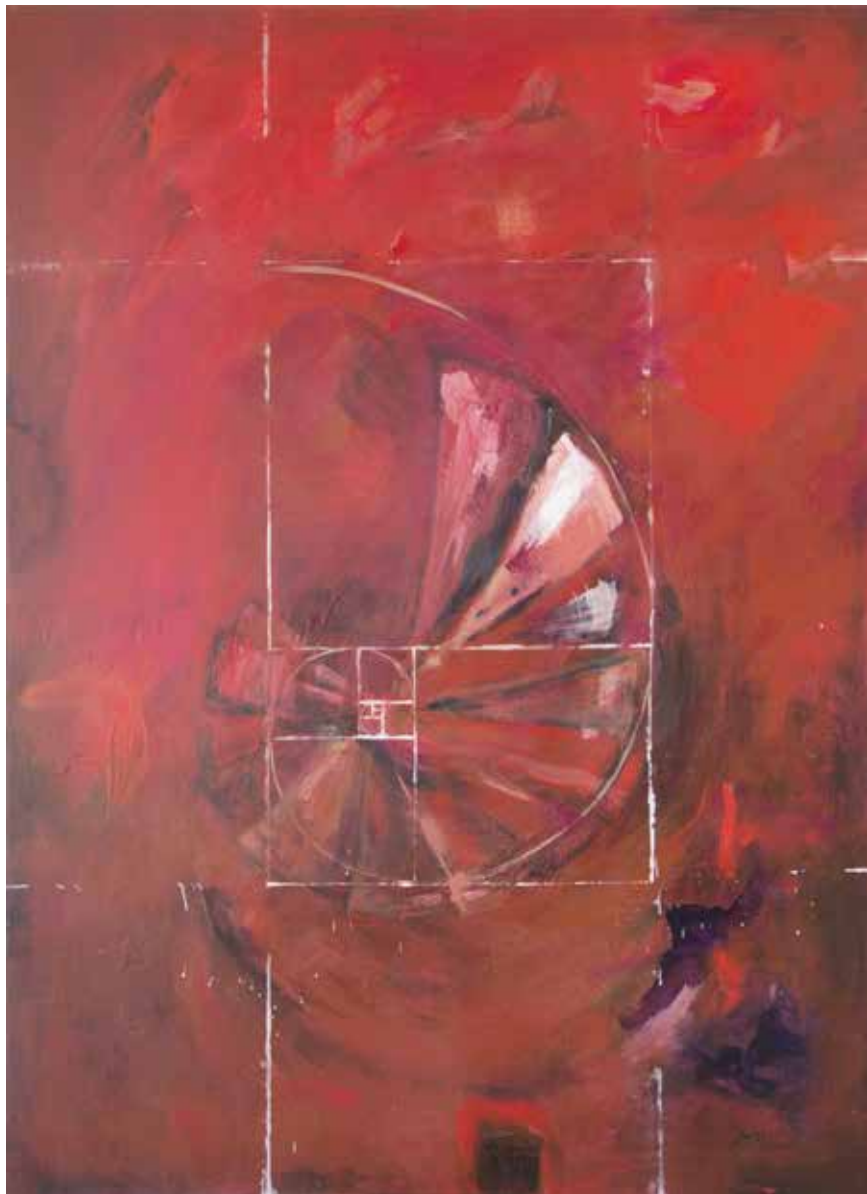
Cuaderno de campo 9-9-2024 "Amonita". 100x73 cm. Acrílico sobre lienzo.