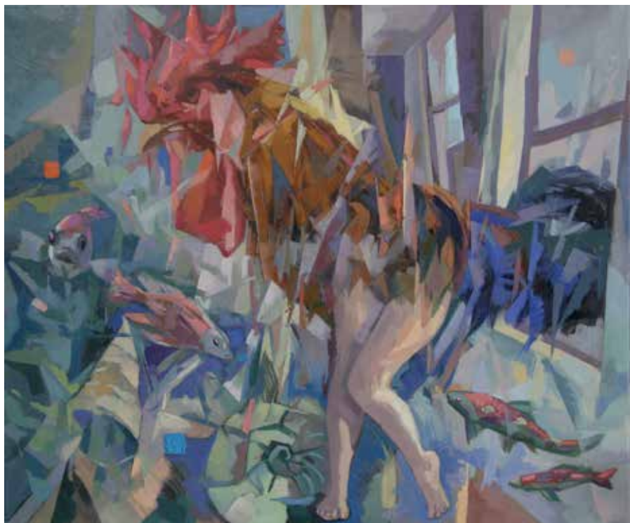
Existencias. 54x64 cm. Óleo sobre lienzo.

pintorjesusmoreno.wordpress.com - pintorjesusmoreno@gmail.com