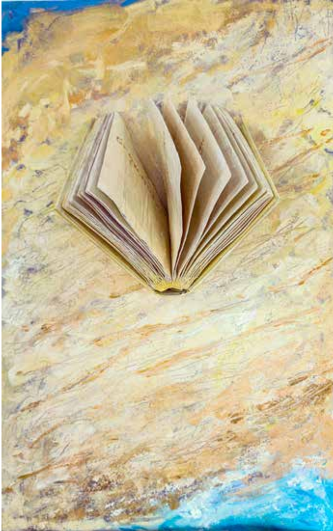
El libro de arena (y agua). 75x47 cm. Montaje. Libro intervenido y óleo sobre tabla.

carche1371b@gmail.com - https://jumilla-amalgama.blogspot.com https://instagram.com/bartolome_medina - https://twitter.com/BartMedina https://facebook.com/bartolome.medinaabellan https://www.youtube.com/channel/UCUdI3BuurrAaaNNqQiLCsCA