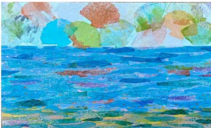
Azul ocupado. 40x65 cm. Técnica mixta (acrílico, collage, arena, acuarela).