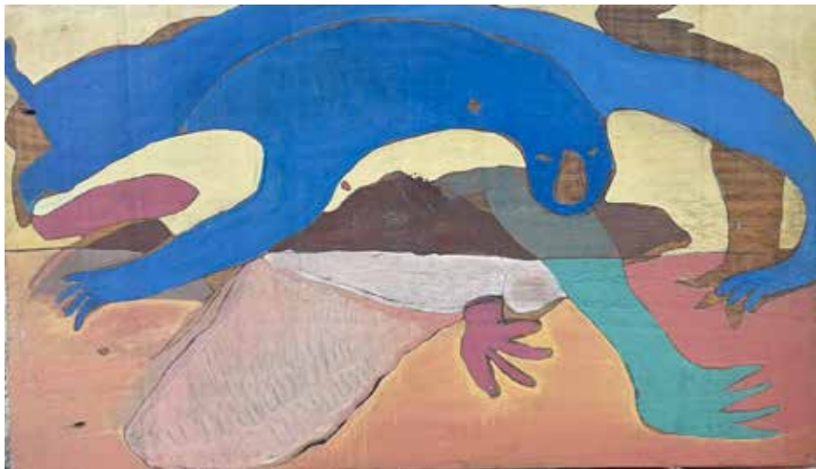
The Guardian. 28x48 cm. Óleo sobre madera.