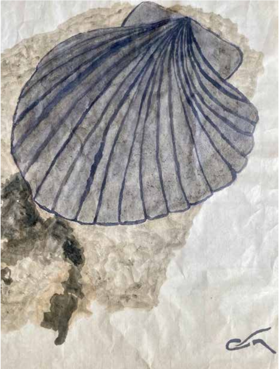
Fòsil. 67x49 cm. Tinta china sobre papel Ukiyo.